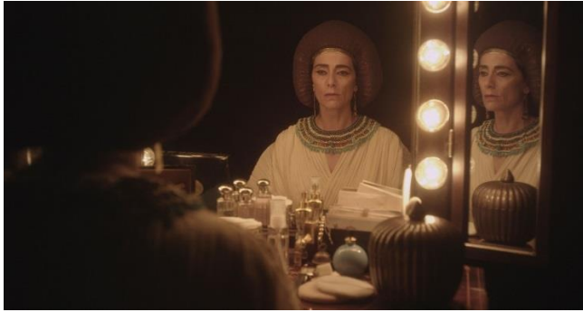
David Krippendorff: Still aus "Nothing Escapes My Eyes", 2015. 12 cm, Holz, Blattgold