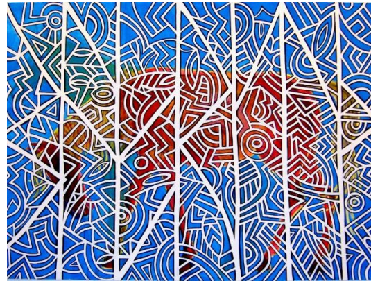
Isolde Wawrin: Inannas Pferd, 1995, 200 x 298 cm, Acryl auf Leinwand