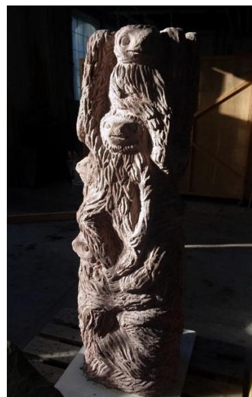
Stefan Rinck: Sloth, Clan, Totem roter Sandstein, 56 x 55 x 38,5 cm