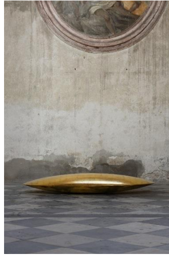
Jindrich Zeithamml: Elipse, 2015, 115 x 57 x Mit Hiam Abbass, 13min. 43sec. HD, color, stereo